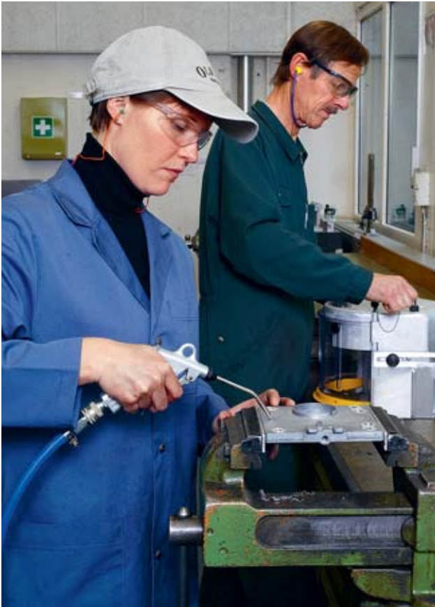
Fig. 4: protections auditives et lunettes sont obligatoires.