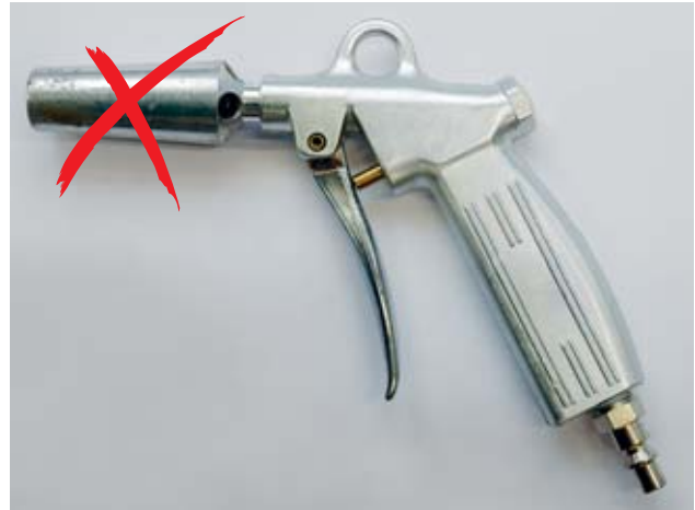
Fig. 2: les soufflettes avec tubes Venturi ne sont pas admises.

Une soufflette équipée d'une buse de sécurité et d'un tuyau de rallonge permet d'éviter de travailler avec la main à proximité de pièces en mouvement (cylindres, etc.).