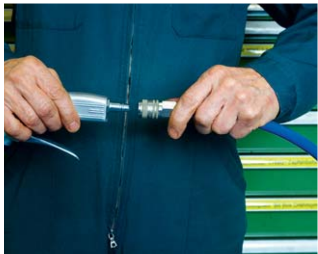
Fig. 6: utiliser des raccords de sécurité.