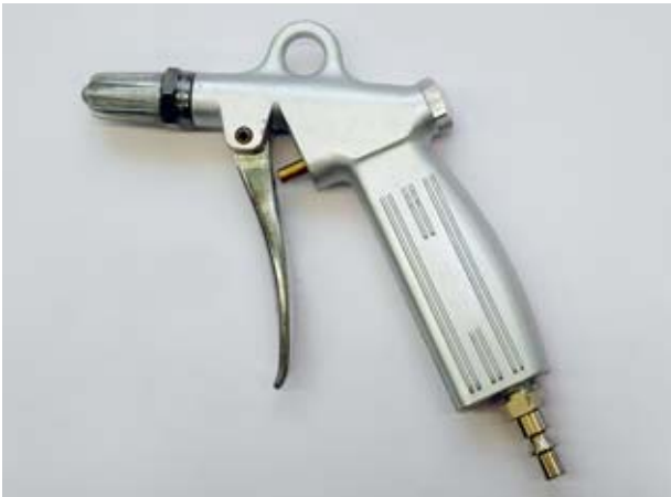
Fig. 1: soufflette avec buse à canaux multiples.