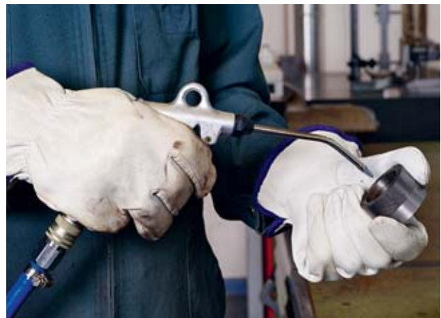
Fig. 3: porter des gants lors du soufflage.